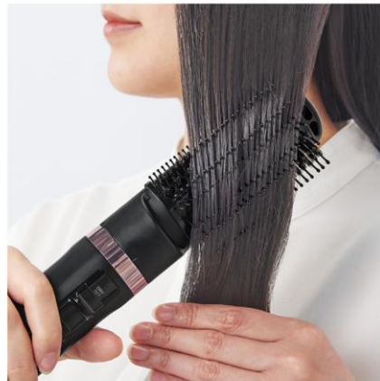
マイナスイオン カールドライヤー TC565A