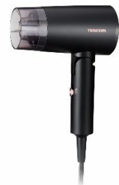
マイナスイオン ヘアドライヤー TD565A

「TC565A」は、国内だけではなく海外でも使用できるように、コインで簡単に AC100-125V/200-250V の電圧幅で切替（※1）が可能です。多くの国で採用されている C タイプのコンセントに対応する C タイプ変換プラグ（※2）も付属し、旅先でも美しい仕上がりのブローが叶います。また、海外でカールドライヤーと共にいつものヘアドライヤーもお使いになりたい方には、パスポート程度のコンパクトサイズで国内・海外両用モデルの「マイナスイオン ヘアドライヤー TD565A」との併用もおすすめです。