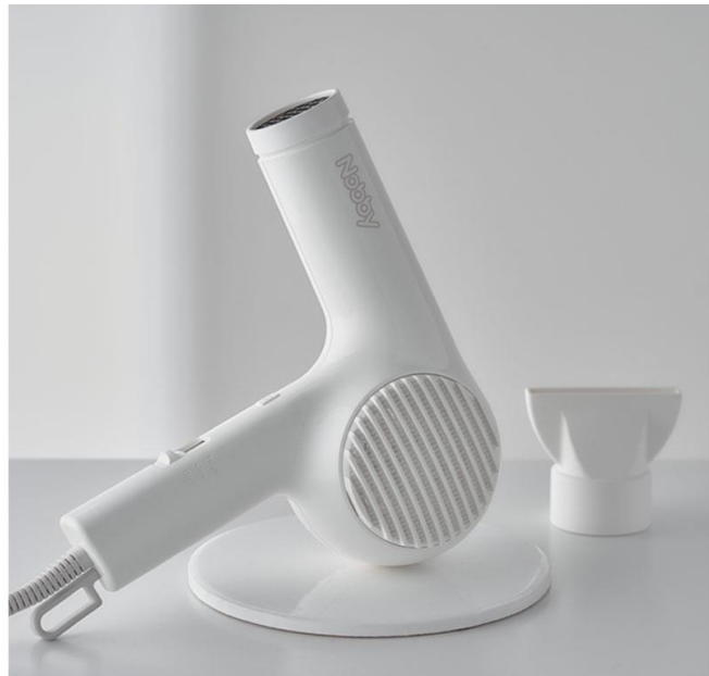
マイナスイオンヘアードライヤー NB2100-W（ホワイト）