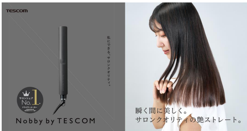
プロフェッショナル プロテクトイオン ヘアアイロン NIS700A-K (ブラック)

テスコム電機株式会社（本社：東京都千代田区、取締役会長兼社長：葉田順治、以下テスコム）は、髪へのダメージ抑制とストレート力の両立を実現した Nobby by TESCO M の最上位ヘアアイロン、「プロフェッショナル プロテクトイオン ストレートアイロン NIS700A」を、2024年12月上旬より順次発売いたします。