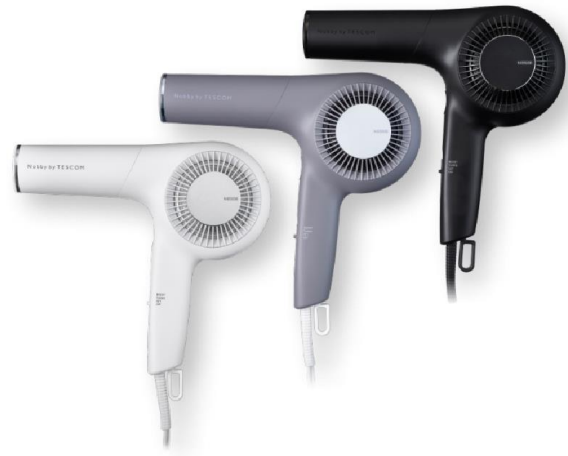
Nobby by TESCO M

プロフェッショナル プロテクトイオン ヘアドライヤー NIB500B-W（ホワイトアッシュ）、-H（スモーキーグレー）、-K（ブラック）