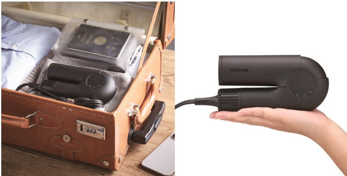
プロテクトイオン ヘアドライヤー TD860A-K（ブラック）

テスコム電機株式会社（本社：東京都千代田区、取締役会長兼社長：葉田順治、以下テスコム）は、本体質量わずか 330g（※1）の手のひらサイズでも、BLDC モーターとプロテクトイオンを搭載したパワフルな風で、ツヤやかな美髪へと導く「プロテクトイオン ヘアドライヤー TD860A」を、2024 年 11 月下旬より順次発売いたします。